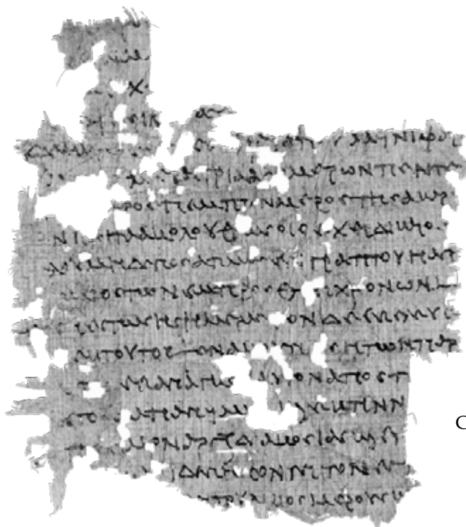
1697. Contrat de vente d'une fraction de terrain